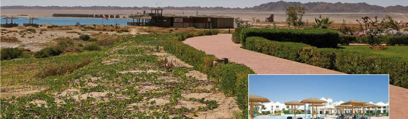
Blick vom Hotel auf die Station