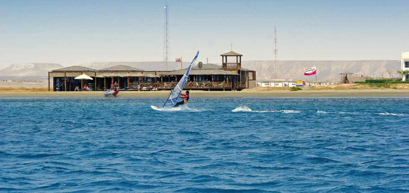
Surfen wie in der Badewanne